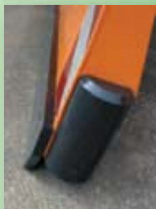
Podaljšani odbijač za robnike