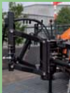
Neodvisen sistem za dviga/spust in obračanje